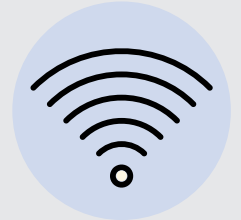
KẾT NỐI DI ĐỘNG HOẶC WIFI

Tôi nói một ngôn ngữ khác. Tôi vẫn có thể được chăm sóc chứ?