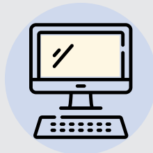
MÁY TÍNH CÓ CAMERA